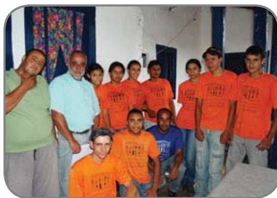
Alunos do Projeto Oficina Escola em São Bartolomeu

O curso é certificado pelo SENAI e teve seu encerramento no dia 28