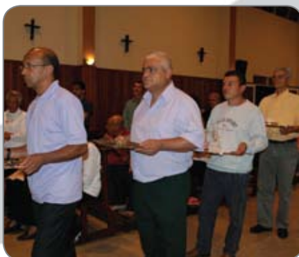
Momento de agradecimento da Fundação Aleijadinho pelos 15 anos de trabalho em prol da comunidade ouro-pretana